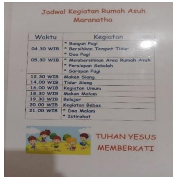
Jadwal Kegiatan Panti

Kristen. Adapun tujuan dari panti asuhan ini adalah untuk membentuk anak-anak yang beriman kepada Kristus, berkarakter baik, dan mampu hidup mandiri. Program yang ada di panti diterapkan pada semua anak, dengan pendekatan yang disesuaikan.