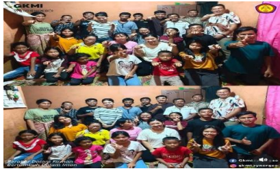
Kegiatan Ibadah Family Lingked

mendengarkan kotbah dan juga ada beberapa kuis tanya jawab dari seorang pembicara. Anak-anak terlihat sedang bernyanyi sambil berdiri dan menutup mata.