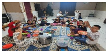
Kegiatan puasa Jumat Setengah hari