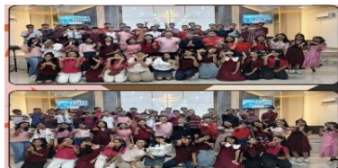
Kegiatan Ibadah Pemuda