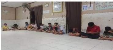
Kegiatan Doa Pagi dan Malam

Berdasarkan hasil telaah dokumen berupa foto kegiatan bahwa kegiatan ibadah yang rutin dilakukan yaitu: doa pagi dan malam, puasa jumat setengah hari, ibadah pemuda, ibadah sekolah minggu, ibadah rumah tangga/ Family linked , dan ada tiga kegiatan untuk menambah skill yaitu: latihan musik, latihan tamborin, dan olahraga yang berupa: karate, futsal.