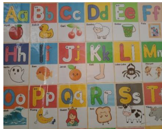
Gambar 4. Media Pembelajaran Huruf Abjad