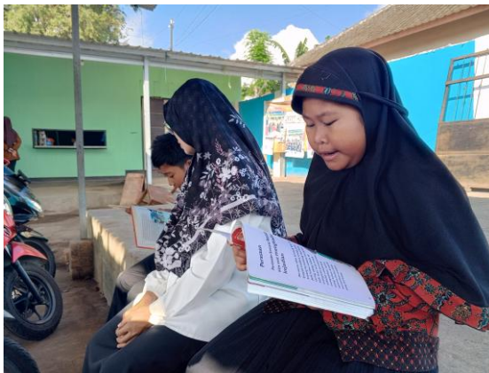
Gambar 1. Kegiatan Bimbingan Membaca Siswa ABK oleh Guru