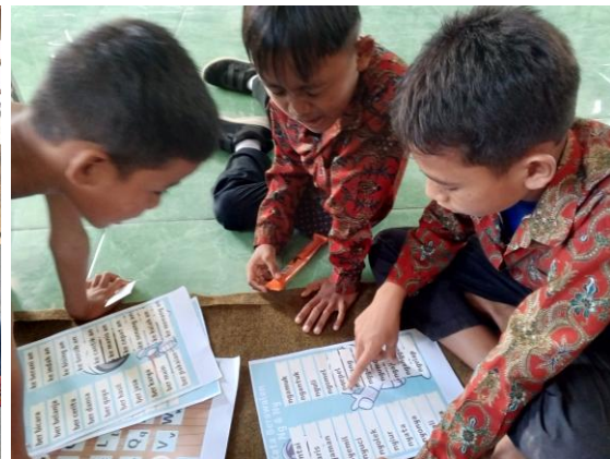
Gambar 2. Kegiatan Membaca dengan Pendampingan Teman Sebaya

Di sisi komitmen, sekolah sekolah sebenarnya telah menunjukkan kepedulian terhadap keberadaan siswa berkebutuhan khusus. Berdasarkan hasil wawancara dan dokumentasi, komitmen ini tertuang dalam visi dan misi sekolah yang ingin “mewujudkan peserta didik yang religius, sehat, kreatif, inovatif, berprestasi, mandiri, dan peduli lingkungan” juga tujuan sekolah yang ingin “mendorong dan membantu setiap siswa untuk mengenali potensi dirinya”, yang pada dasarnya selaras dengan pandangan Phytanza et al. (2023) bahwa sekolah inklusif terbuka bagi semua siswa dan bertujuan mengembangkan potensi setiap anak. Hasil observasi, wawancara dan dokumentasi memperkuat bahwa komitmen tersebut juga tampak dalam praktik sehari-hari, misalnya melalui bimbingan membaca yang diberikan guru dan kegiatan literasi mingguan. Meskipun kegiatan tersebut belum ditujukan secara khusus untuk anak disleksia, hal ini menunjukkan adanya perhatian guru terhadap kebutuhan belajar yang beragam. Selain itu, hasil observasi dan wawancara juga menunjukkan adanya komitmen sekolah melalui