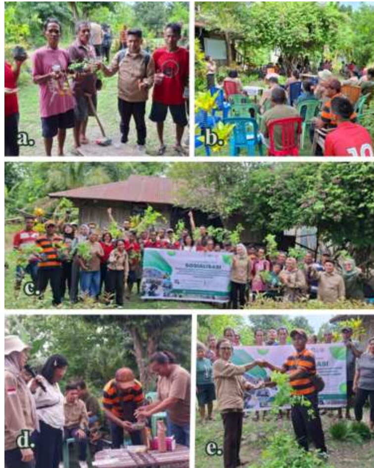
Gambar 3. Penyerahan benih gmelina (a), Pemberian materi rumput Umma Gumami (b), Kebersamaan dengan kelompok di Desa Noekele (c), Pembuatan teh bunga telang (d), Penyerahan bibit tanaman bunga telang (e)