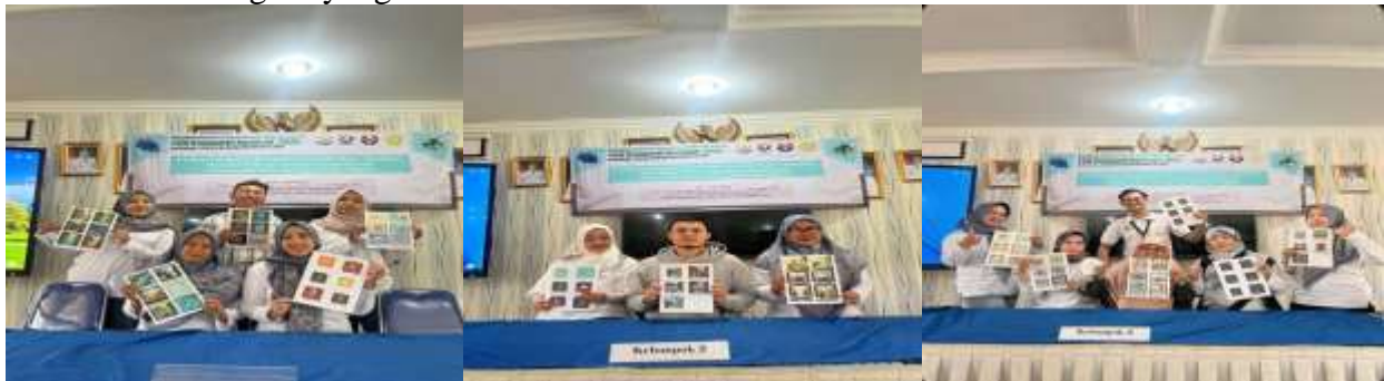
Gambar 8. Guru memamerkan hasil generative AI problem mat untuk setiap matapelajaran.

Pada fase ini, peran guru ditingkatkan menjadi produser konten. Guru dilatih merekam video tutorial langkah kerja menggunakan overhead tripod (Modul 3.1) dan menyusun narasi, deskripsi, serta tautan video ke dalam Template Pengisian LKPD Digital. Pelaksanaan fase ini menghasilkan luaran kolektif berupa kumpulan draf LKPD Digital yang terstandarisasi.