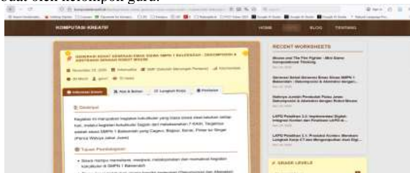
Gambar 6. Halaman LKPD Digital pada Komputasikreatif.id