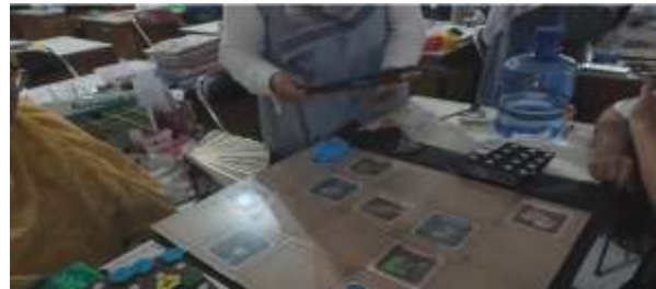
Gambar 7. Guru menggunakan Hexagon Chips dan Card Mat Modular.