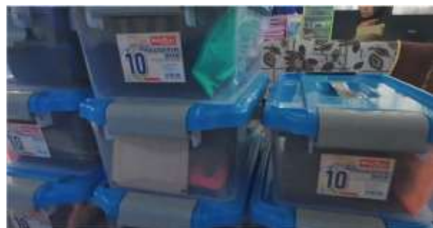
Gambar 4. Ilustrasi Prototype Card Mat Modular dan 10 Set 25 Card Modular