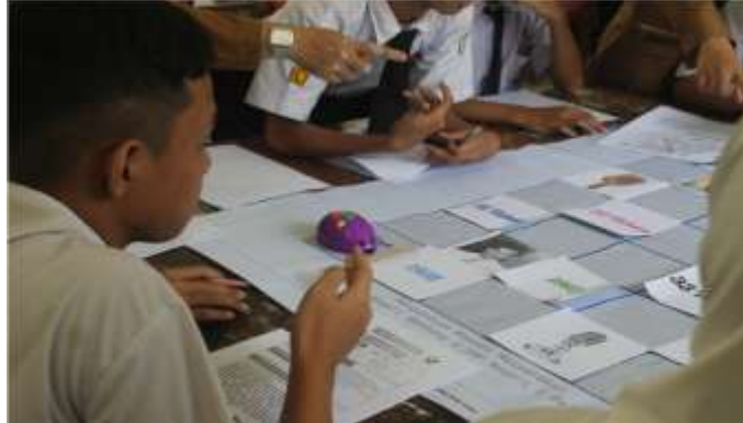
Gambar 2. Ilustrasi Card Mat bahan spanduk yang bergelombang, dan kusut.

Penugasan (Hadi Soekamto, 2020). Meskipun pelatihan tersebut telah dilaksanakan, evaluasi implementasi di lapangan mengungkapkan tiga tantangan signifikan yang menjadi fokus kegiatan PKM saat ini. Tantangan ini dapat dikategorikan menjadi dua isu prioritas: (1) Kesenjangan Kompetensi Pedagogis yang berimplikasi pada aspek sosial kemasyarakatan, dan (2) Inefisiensi Operasional yang berkaitan dengan aspek manajemen pembelajaran.