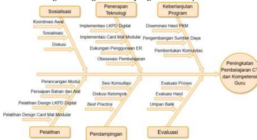
Gambar 3. Fishbone Diagram Pelaksanaan PKM.

Pelaksanaan pengabdian kepada masyarakat ini menggunakan pendekatan partisipatif dengan intervensi hibrida yang terintegrasi. Pendekatan partisipatif diterapkan dengan melibatkan secara aktif 25 guru SMP Negeri 1 Baleendah, yang terdiri dari 9 guru laki-laki dan 16 guru perempuan. Para peserta berasal dari berbagai latar belakang mata pelajaran (multidisiplin), meliputi rumpun Matematika dan Ilmu Pengetahuan Alam (MIPA), Informatika, Bahasa, Ilmu Pengetahuan Sosial (IPS), hingga Seni Budaya. Keterlibatan peserta mencakup seluruh tahapan kegiatan, mulai dari identifikasi masalah, pengembangan solusi melalui media hardware dan software, hingga tahap evaluasi program. Kegiatan pengabdian ini dilaksanakan di SMP Negeri 1 Baleendah, Kabupaten Bandung, Jawa Barat. Waktu pelaksanaan terbagi dalam tiga fase inti yang dilakukan pada bulan November 2025.