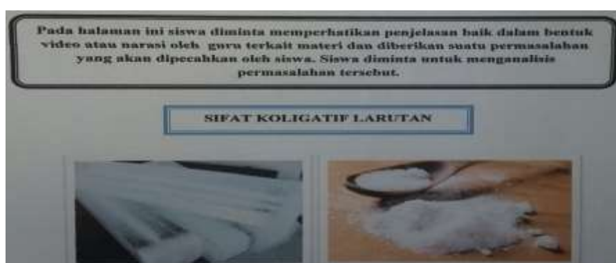
Gambar 1 Aktivitas dalam LKS Es batu dan Garam

Dalam pembelajaran proyek siswa diminta untuk melakukan hipotesis, menurut saya ini sulit dilakukan karena mereka belum terbiasa untuk belajar mandiri. Mereka terbiasa mengandalkan guru. Selain itu siswa banyak yang belum membaca materi tentang sifat koligatif larutan sebelumnya, ini terlihat ketika mereka diminta untuk berhipotesis, munculnya hipotesis diluar yang diharapkan (Scarborough et al., 2004). Misalnya ketika guru menampilkan sebuah gambar diantaranya gambar Es batu dan garam. Siswa kurang mampu menafsirkan gambar tersebut, karena menurut mereka guru yang akan menjelaskan gambar tersebut. Seperti pada gambar 1.